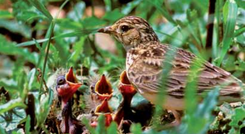
Ptáci hnízdící na zemi mohou přežít jen na málo intenzivních plochách (skřivan polní).