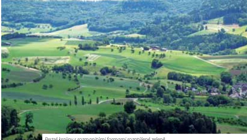
Pestré krajiny s rozmanitými formami rozptýlené zeleně.