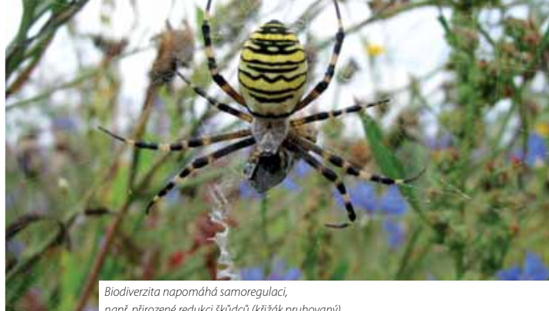
Biodiverzita napomáhá samoregulaci, např. přirozeně redukcí škůdců (křížák pruhovaný).

(obr. 2). Největší rozdíly byly zjištěny u extenzivních luk, stejně jako křovin a vysokokmenných ovocných stromů v nížinné a vrchovinné zóně [20].