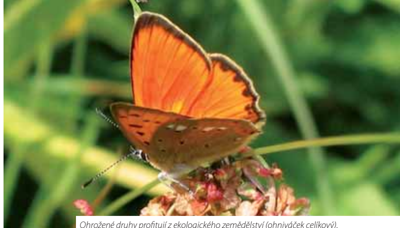
Ohrožené druhy profitují z ekologického zemědělství (ohniváček celíkový).