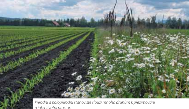
Přírodní a polopřírodní stanoviště slouží mnoha druhům k přezimování a jako životní prostor.