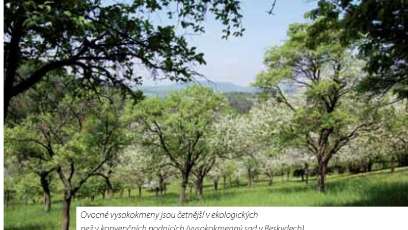
Ovocné vysokokmeny jsou četnější v ekologických než v konvenčních podnicích (vysokokmenný sad v Beskydech).